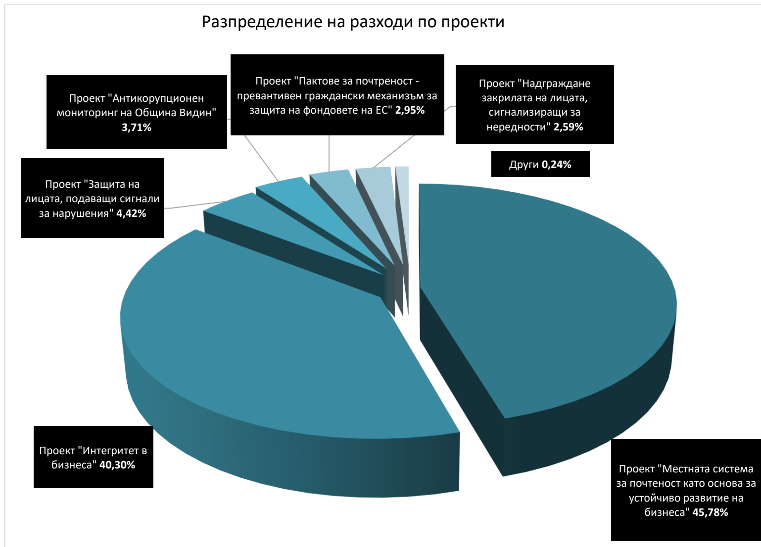
Разпределение на разходи по проекти

ОТЧЕТЕН ДОКЛАД ЗА ДЕЙНОСТТА ПРЕЗ 2022 ГОДИНА